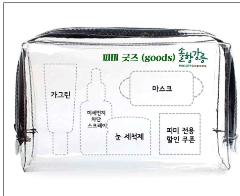
▲ 가그린, 미세먼지 차단 스프레이, 눈 세척제, 마스크. 강릉 내 할인 쿠폰 등이 포함된 패키지 물품