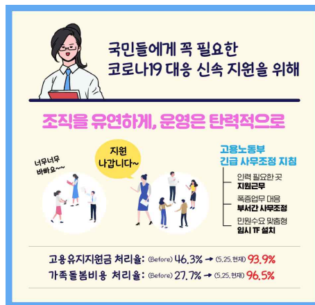
▲ 탄력근무제 시행 사례